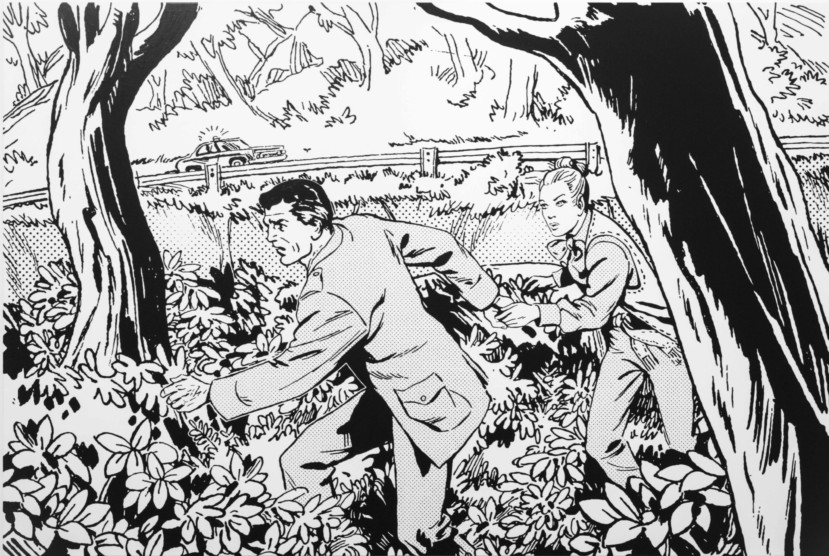
A TRAVÉS DE ELLA (ESCAPE) ACRÍLICO SOBRE TELA 180 CM X 120 CM 2020