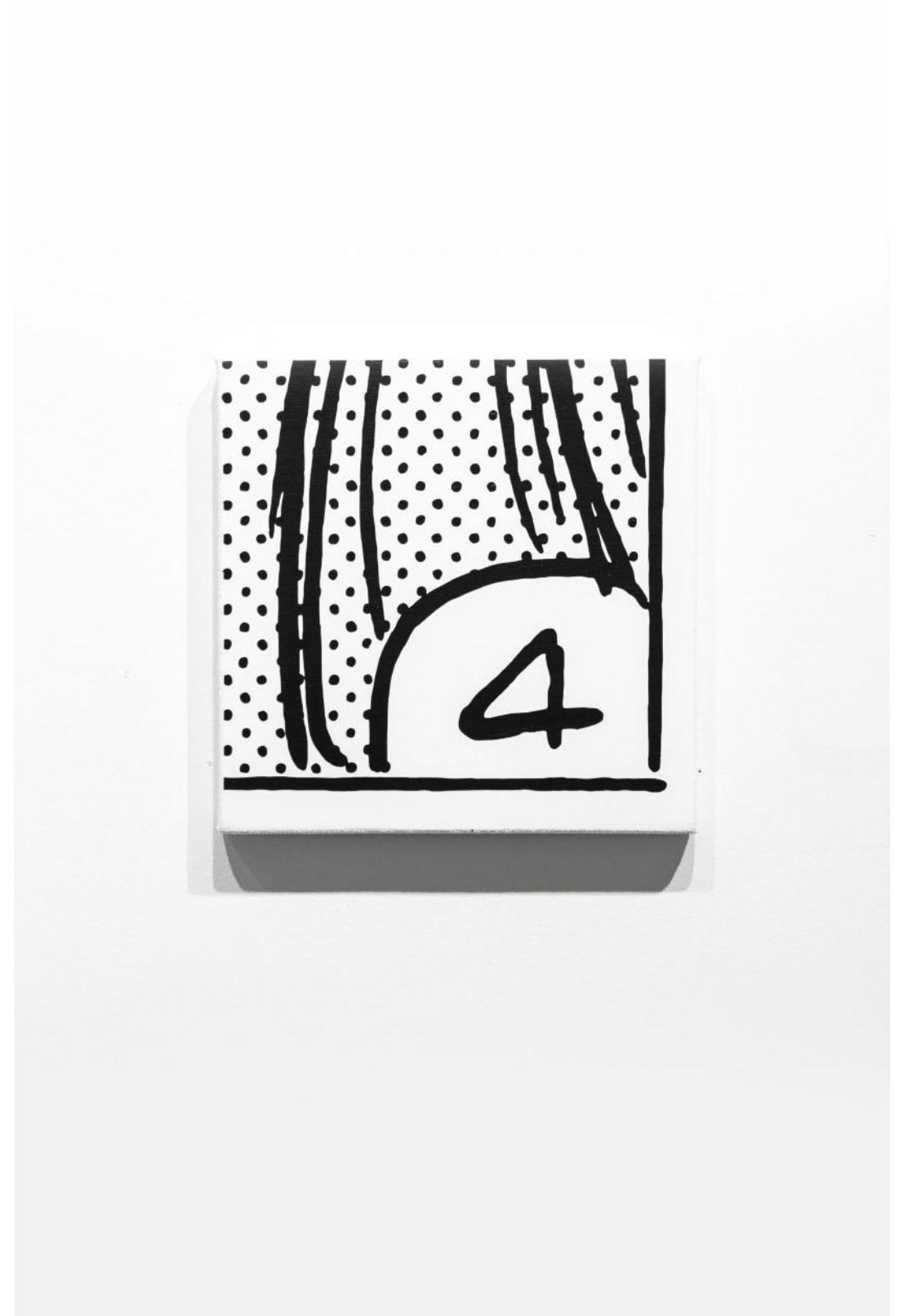
CUATRO #2 ACRÍLICO SOBRE TELA 20 CM X 20 CM 2020