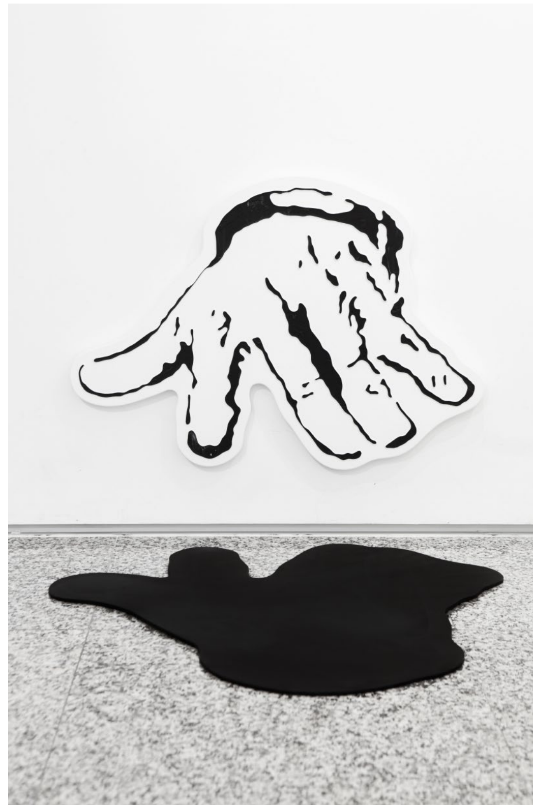
A TERRA (SINISTRA) #1 ACRÍLICO SOBRE TELA 68,5 CM X 48,3 CM 2020