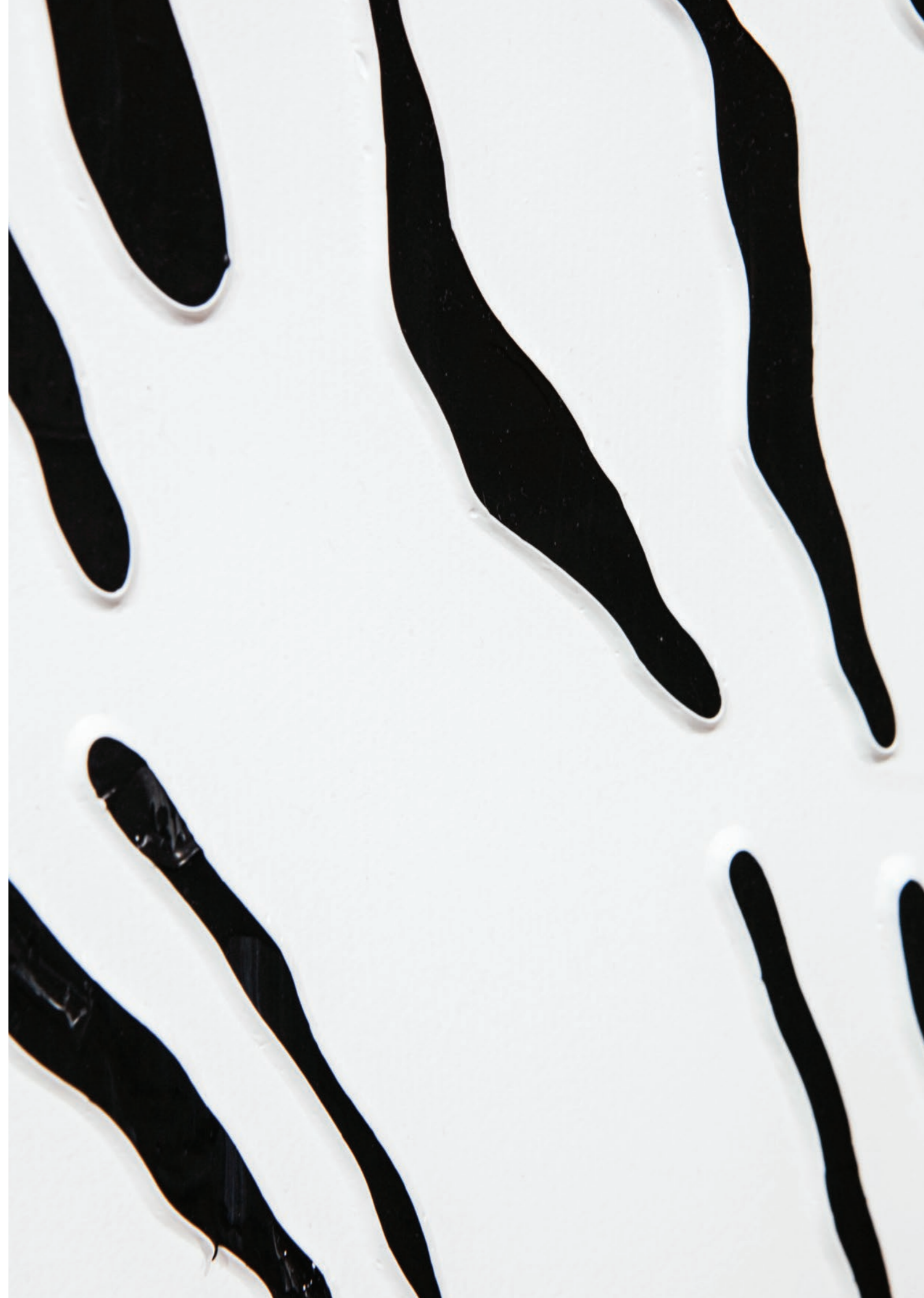
DOCE #1 ACRÍLICO SOBRE TELA 20 CM X 20 CM 2020