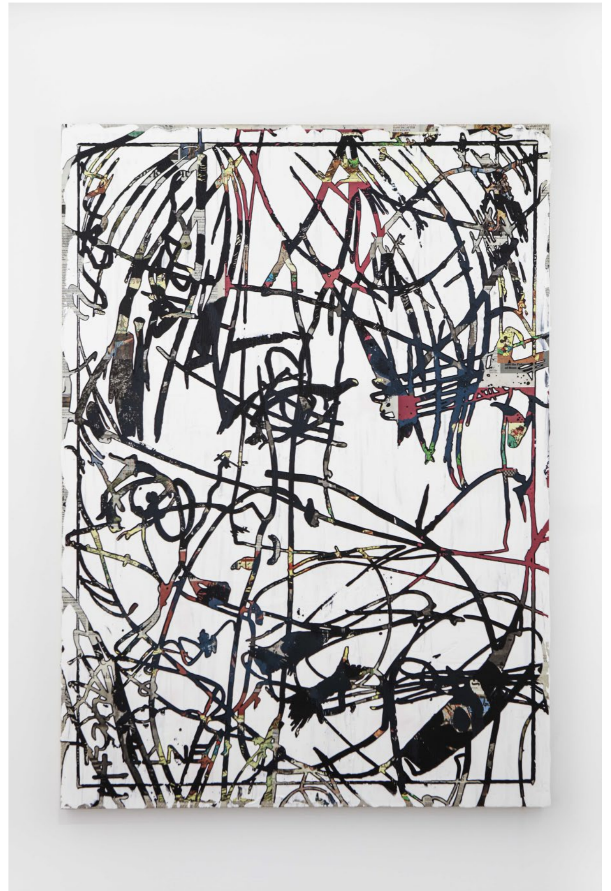
CARACTERÍSTICAS DEL ESTADO ADULTO #2 ACRÍLICO SOBRE TELA 100 CM X 140 CM 2020