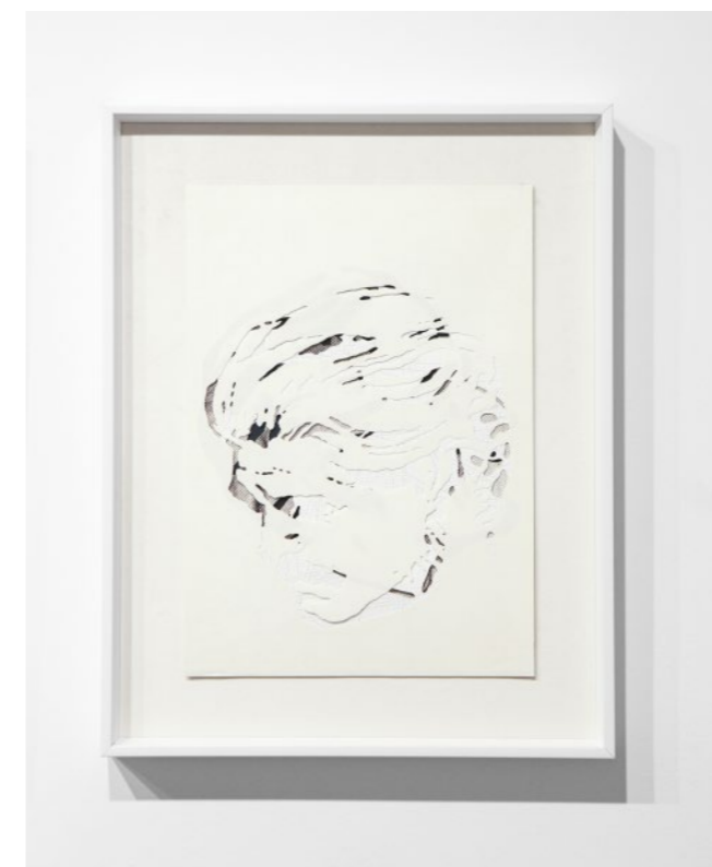
A.B. #1 AL #11 PAPEL CORTADO, ACRILICO, IMPRESIÓN DIGITAL SOBRE PAPEL 21 CM X 29.5 CM 2020