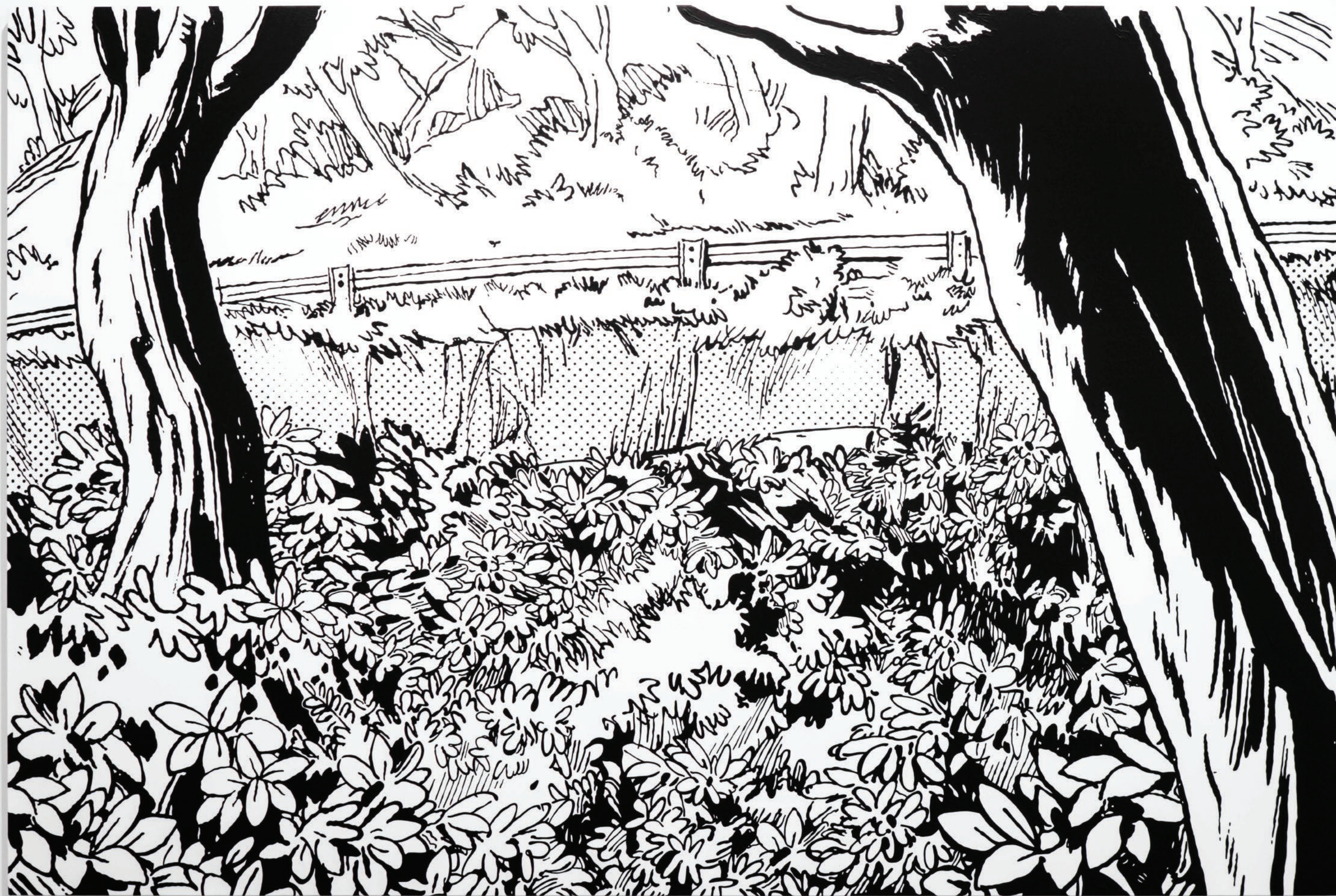
ESCAPE ACRÍLICO SOBRE TELA 180 CM X 120 CM 2020