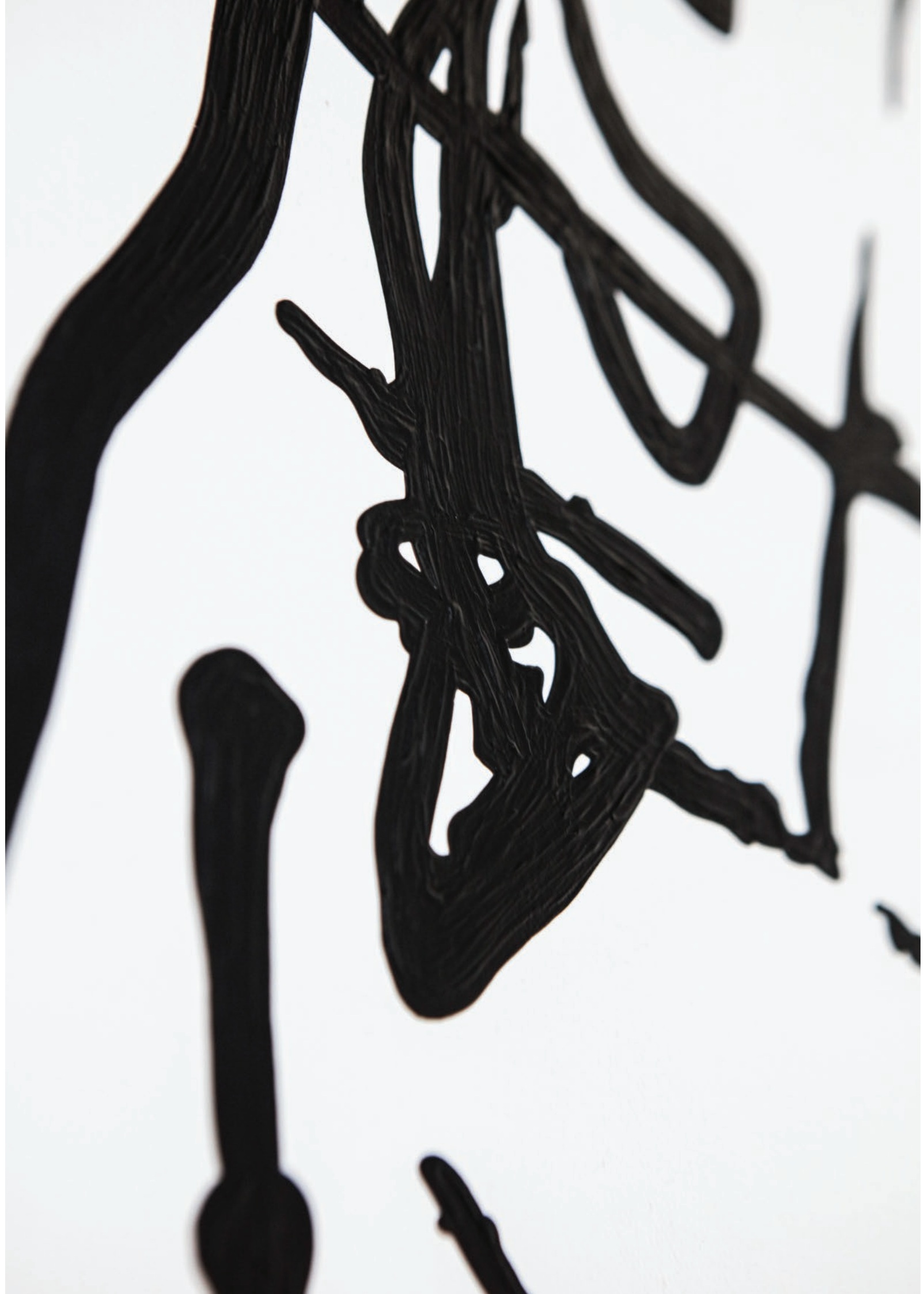
ONCE #2 ACRÍLICO SOBRE TELA 20 CM X 20 CM 2020