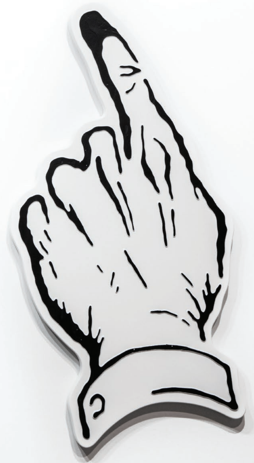
A PUNTA (DESTRA) #1 ACRÍLICO SOBRE TELA 59,3 CM X 80,7 CM 2020